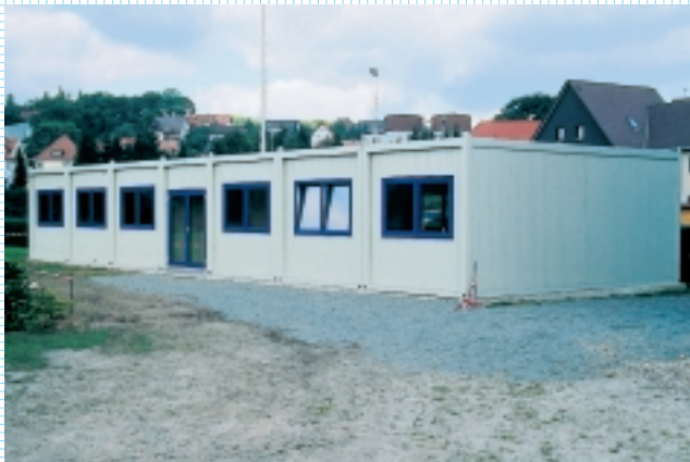
Hier gibt's Wissen