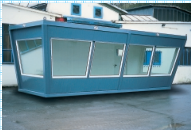
...Power im Tower!