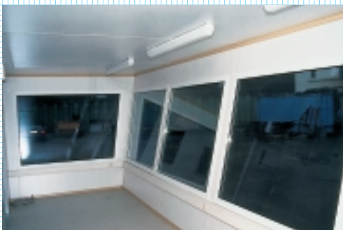
Von Innen und Aussen...