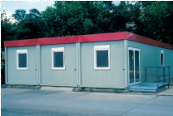
Hier dekontaminieren wir