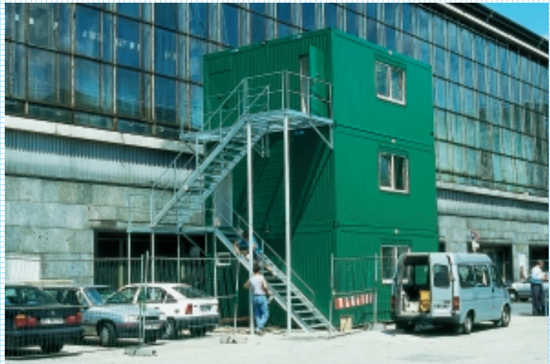
Stapelung übereinander schafft hohen Raum

Mit WEIRO Containern werden individuelle Raumlösungen schnell und kostengünstig Wirklichkeit.