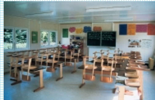
für unsere Kinder