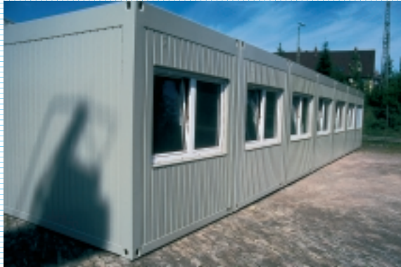
Längsseitige Kopplung schafft tiefen Raum

Mit WEIRO Containern werden individuelle Raumlösungen schnell und kostengünstig Wirklichkeit.