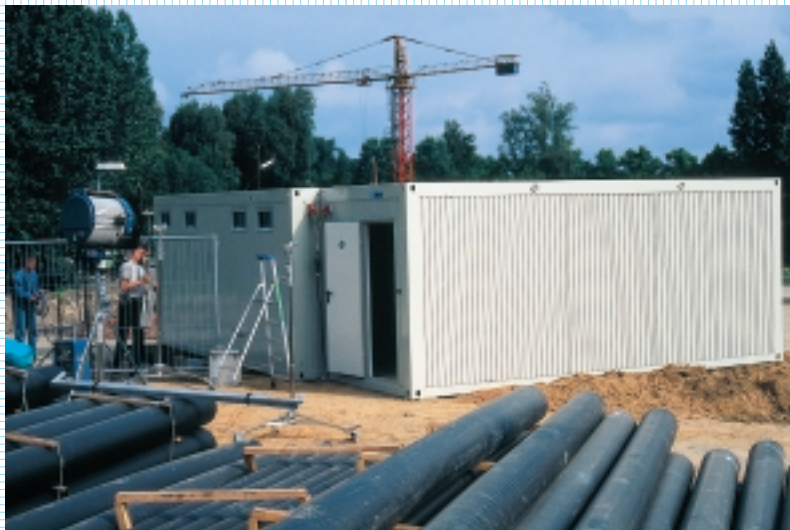
Kopplung über Eck schafft flexiblen Raum