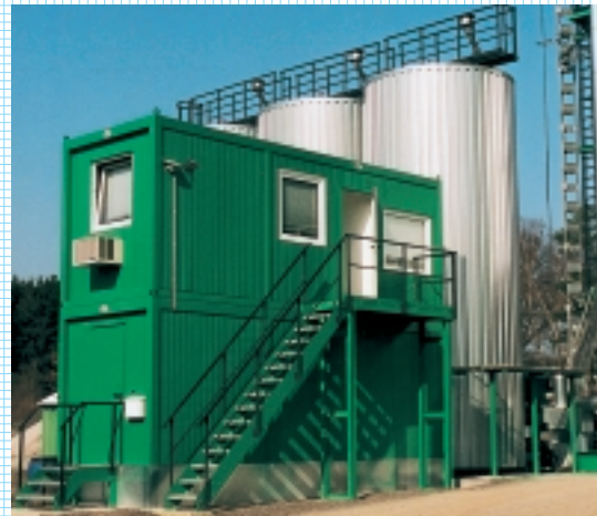
Hier steuern wir zentral Asphalt

WEIRO Container sind flexibel und daher für die vielfältigsten Einsatzzwecke geeignet