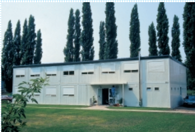
Hier gibt's Geld