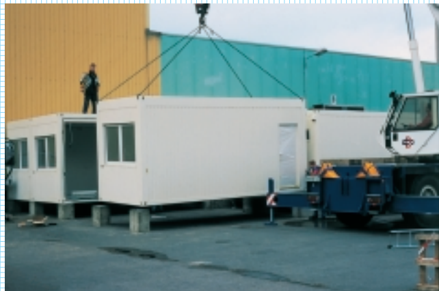
das ist nicht schwer!