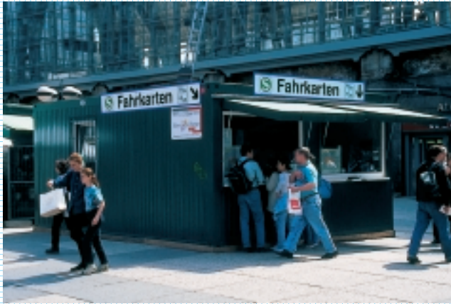
Hier gibt's Tickets