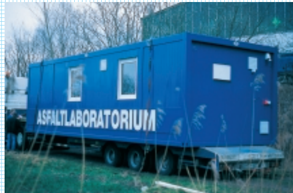
Jetzt geht's zum Kunden