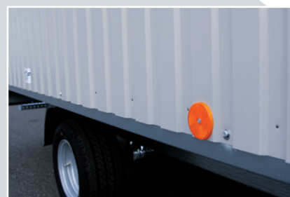
Fußboden aus einteiligem, geschäumtem Sandwichelement mit umlaufenden Bodenrahmen und Blindboden aus verzinktem Stahlblech