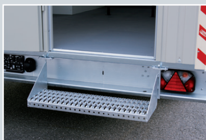
Robuste, feuerverzinkte Einstiegstreppe