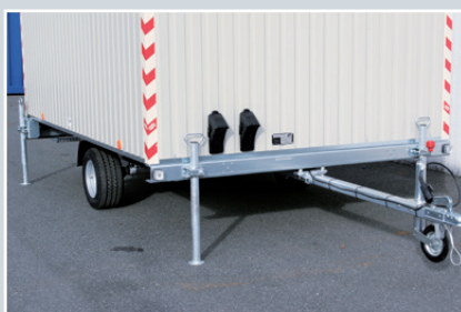
Fahrgestell aus verzinkten Leichtbauprofilen , verzinkte Eckrohrstützen