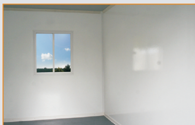
heller freundlicher Innenraum