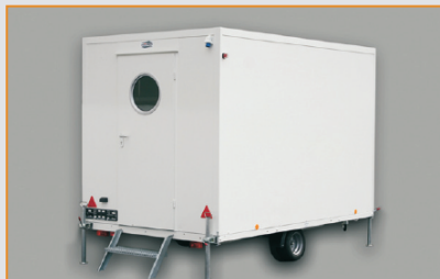
Tür in Sonderausstattung: runder Fensterausschnitt