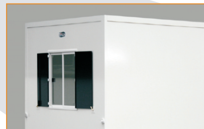
Kunststoff-Schiebefenster mit Stahl-Fensterklappen