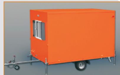
Sonderlackierung in allen RAL-Farbtönen