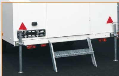
verzinkte Rohrstützen, verzinkte Treppe